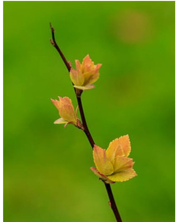
Spiraea japonica 'Goldflame' 06